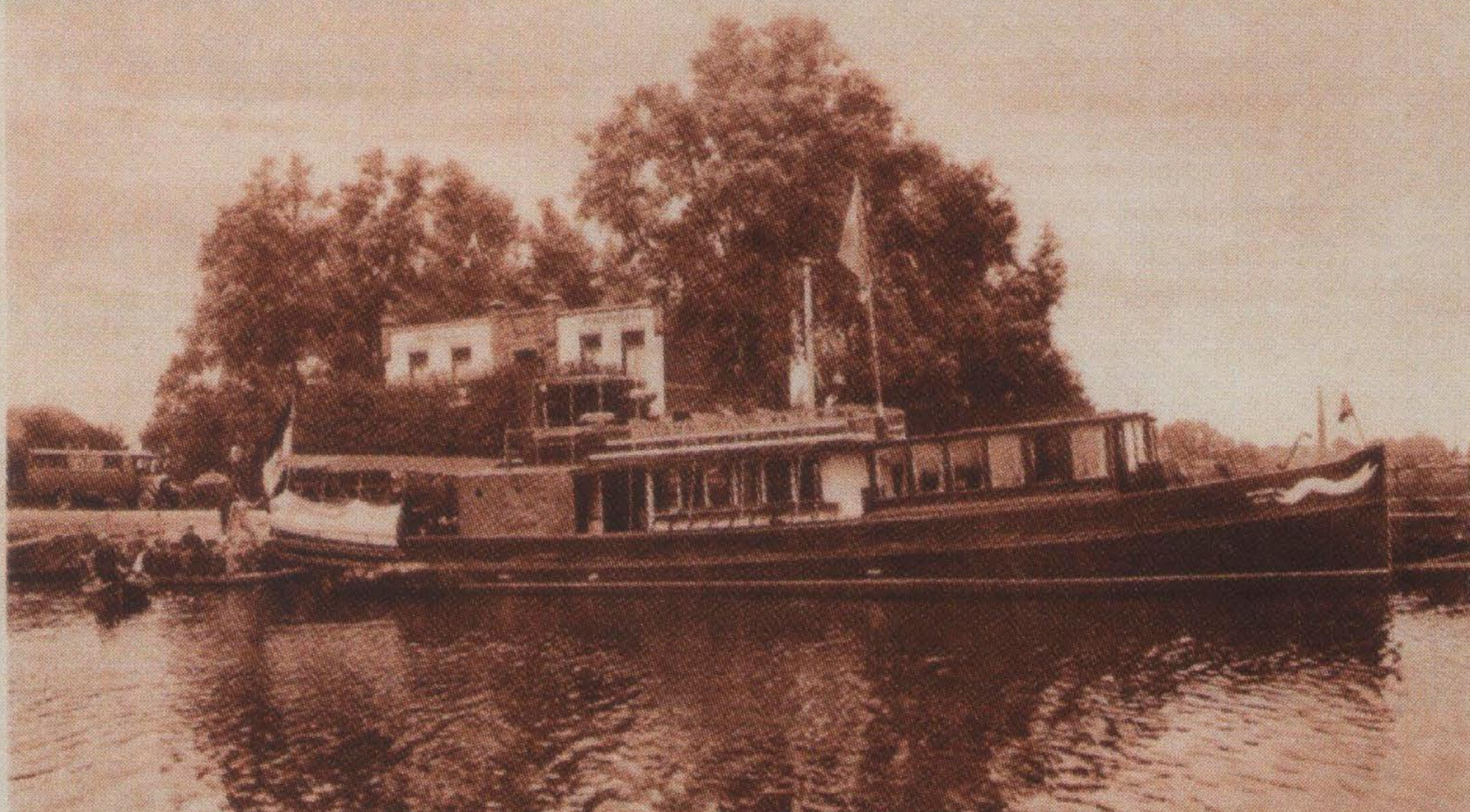
Giethoorn. Hotel Prinsen. Afvaart van de Zwolsche boot „Ora et Labora.